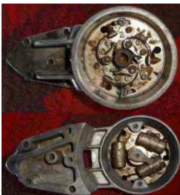
F11 /Junior d.L. Zündungsplatte in Gehäuse 15,--