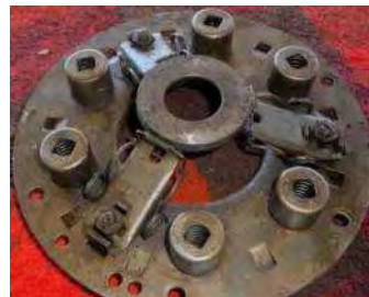
F11 Kupplungsdruckplatte Fichtel & Sachs 11,-