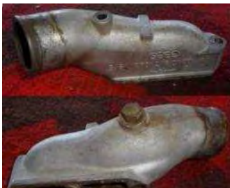
F11 Kühlwasserstutzen 10,--

BÖRSE VERKAUF Günter ZUMPF guenter.zumpf@gmail.com 0664-73008302