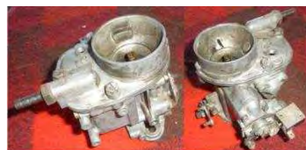
F11 /Junior d.L. Vergaser bestückt Komplett gereinigt und geprüft 150,--