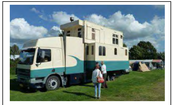
2-Stock-Wohnmobil Marke Hollandaise