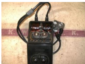
19 Spulenkasten, Bakelit, kompl., neuw., absolutes tadelloses Einzelstück (nicht gepr.), mit originalen Zündkabeln, zusammenhaltender Gummilasche mit DKW-Schrift und Kerzensteckern. € 490,-