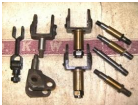
18 Federgabel- Teile, neuw., teils f. F7, teils F8 (rechte Bildhälfte, plus 4 Feder-Bolzen, nur drei Ms-Buchsen dazu, neu). Nur zusammen €: 375,-