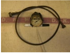
16 Tachometer plus Tacho-Welle, gebr. € 145,-