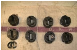
17 Antriebs-Scharniergelenke 1 Paar kompl., plus 2 Federscheiben € 185,- 1 Paar komplett € 170,- 1 Paar ohne Bolzen € 145,- 1 Paar ohne Bolzen € 145,-