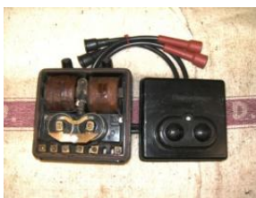
20 Spulenkasten, Bakelit, kompl., neuw., tadelloses Stück (nicht gepr.), mit neuen Zündkabeln. € 445,-